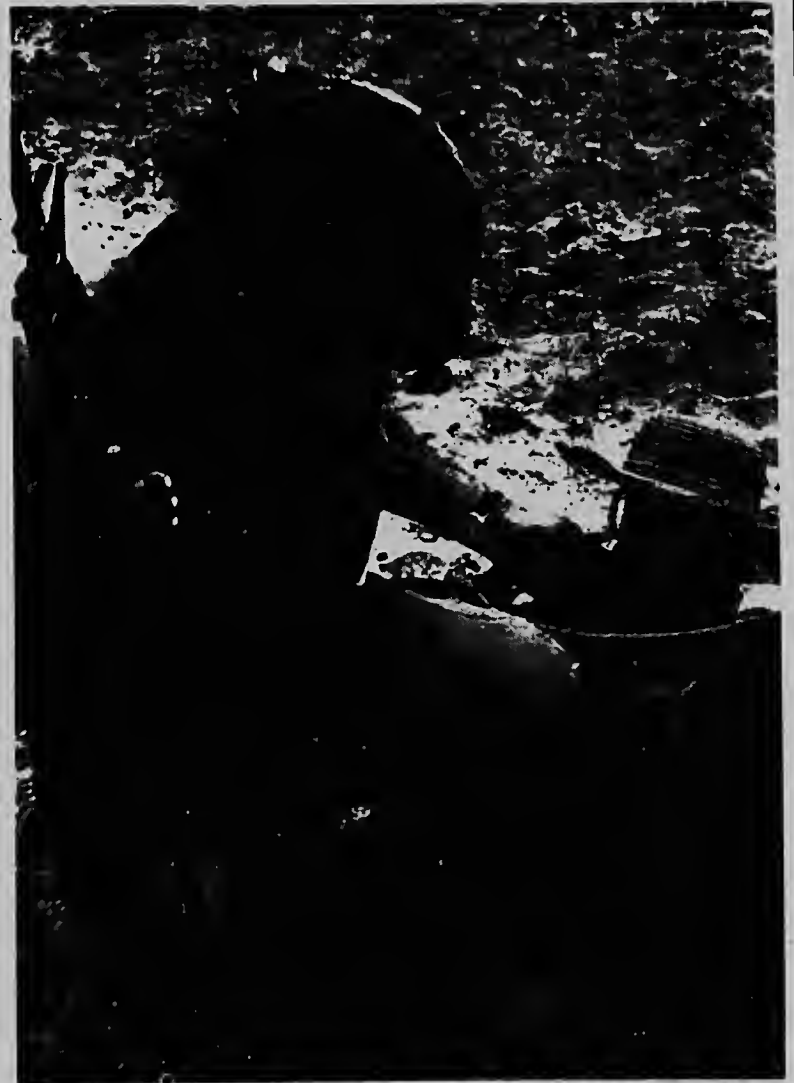
Un soldá desconoci di cavaleria norteamericana, aki ta tratando di bira amigu cu un Survietnames chikitin qu tabata pará den un maku-tu den un pueblo qu e mericanonan a pasa den dje durante un operacion militar reciente. Mama di e yiu a ser interrogá despues.

Pero te ainda nan ta resisti. Di con ? Pasobra tin otronan nan tras qu ta interesa na tin un base comunista den e parti ei di mundu. Y esun mas cerca y mas tantu interesá ta China Comunista.